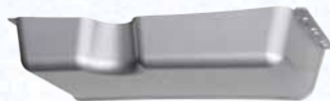
Copertura raccordi cod.: COPRAC900P

Una tecnologia nel rigoroso rispetto della base scientifica che utilizza materiali nobili e idonei a svolgere appropriate quanto differenti funzioni.